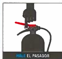
HALE EL PASADOR

para desbloquear el extintor, apuntando lejos de usted.