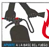
APUNTE A LA BASE DEL FUEGO

para desbloquear el extintor, apuntando lejos de usted.