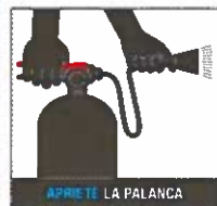
APRIETE LA PALANCA

y colóquese a una distancia de entre 2 y 3 metros. (Apuntar a la llama podría empeorar el fuego).