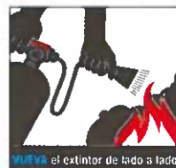
MUEVA el extintor de lado a lado

lentamente y uniformemente para descargar el agente.